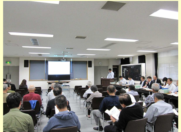
第3回事業報告会の様子

※ 事業報告会の議事概要といただいたご意見への補足事項は、本組合ホームページに掲載しています。