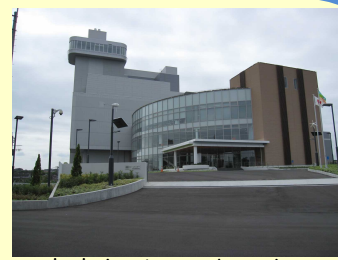
高座クリーンセンター

同施設はストーカ炉（2炉）を採用しているほか、浸水対策のための地盤面の高上げやランプウェイ方式の採用など、本組合の整備計画に類似する特徴を持つ施設です。また、煙突の高さは59mで、煙突と一体的に整備された展望室があります。