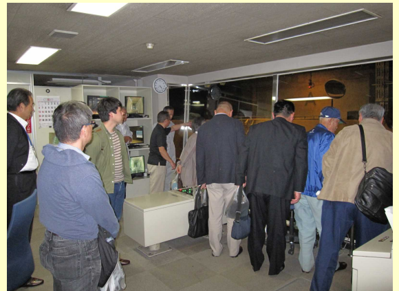
厚木市環境センター施設見学の様子